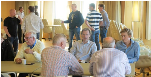
Glasmästartidiskussioner i Malmö...

Under det gångna året har fokus legat på nya marknadsområden där fönsterbyte har dominerat diskussionen.