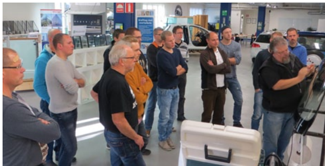
En av bilglasträffarna hölls på Glasskolan i Katrineholm, här med studier i stenskottslagning.