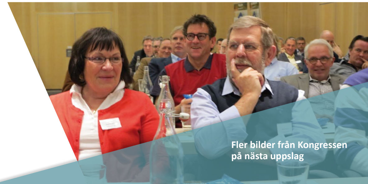
Fler bilder från Kongressen på nästa uppslag