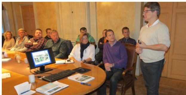
...och i på GBFs kansli i Stockholm