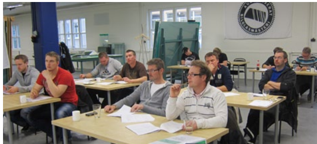
Glasskolans lokaler har utvecklats för att passa för såväl som praktik.

GBFs intensifierade satsning på ett brett utbildningsprogram fick bra genomslag under verksamhetsåret. Kurser inom GBFs olika verksamhetsområden förläggs i ökad omfattning till Glasskolan i Katrineholm, som utvecklats till branschens utbildningscentrum för både glasmästare, bilglasmästare, fasadföretag och konstinramare.