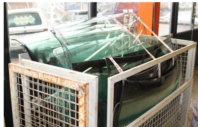
Återvinningen av bilrutor har lagt sig på en jämn nivå.

Utbildningen av bilglasmästare fortsätter med grund- och vidareutbildningar. Denna är utformad som tidigare: Grundutbildningens första dag är teoretisk och dag två är praktisk. Dag ett innehåller bland annat information om vilka avtal som gäller mellan bilglasmästarna och deras kunder, något som har blivit allt viktigare när det gäller garantier, arbetsmiljö, personlig skyddsutrustning, val av rätt arbetsmetoder och att utföra fackmannamässigt arbete. Dag två innehåller olika typer av byten av vindrutor, där man får prova olika metoder för demontering av bilglas och samtidigt uppfylla kraven på säkra reparationer. Här går man också igenom stenskottslagning. Vidareutbildningen är en uppföljningskurs för dem som gått utbildningen. Den ger bland annat kunskap om säkra reparationer och repman.gbf.se.