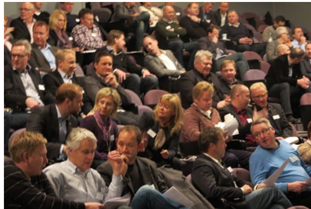
På Fasaddagen i Stockholm diskuterades ivrigt bland annat konjunktur, energifrågor och kompetensutveckling mm.

Ett verksamhetsår präglad av en ökande konkurrens från utländska aktörer på den svenska marknaden påverkade GBFs entreprenadföretag kännbart. För att få till stånd konkurrens på lika villkor fördes diskussioner med både Ekobrottsmyndigheten, Skatteverket och andra organisationer i byggbranschen.