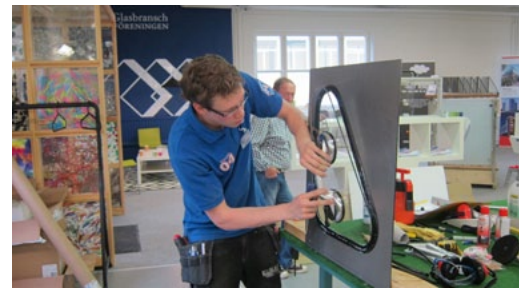
Yrkesprovets olika moment kräver i regel noggranna förberedelser, för det osm på hemmaplan kan verka enkelt blir svårare under tids- och granskningspress.

Arbetet med att revidera branschens utbildningshäften har fortsatt. Under året har de två häftena Isolerrutor och Konstinramning kommit i omarbetat nytryck.