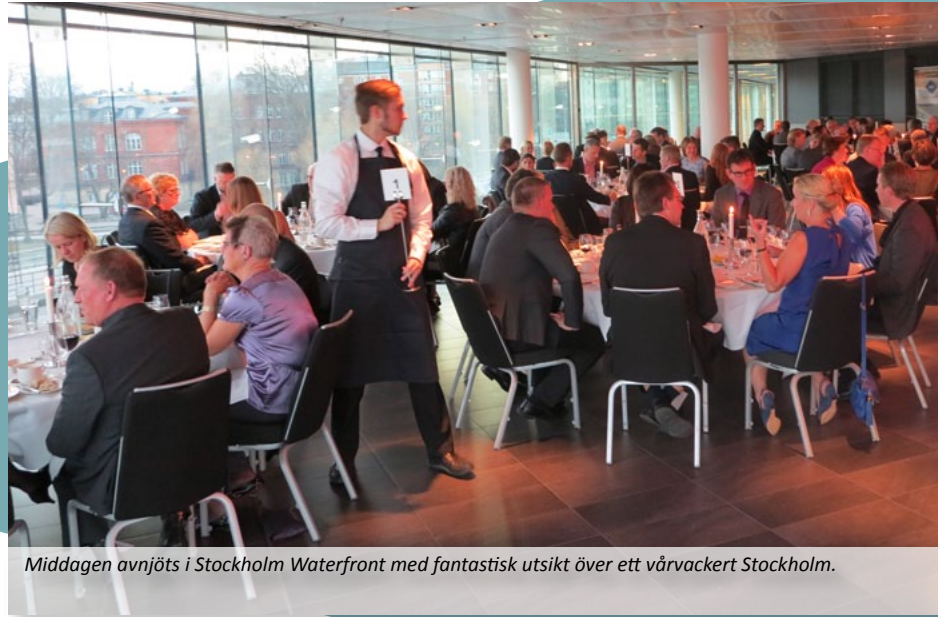
Middagen avnjöts i Stockholm Waterfront med fantastisk utsikt över ett vårvackert Stockholm.