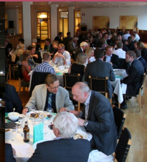
God stämning på banketten.