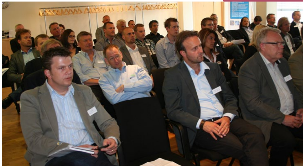
Kongressdeltagarna lyssnade koncentrerat till de olika föredragen.