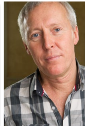
Mikael Ödesjö Kommunikation