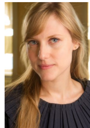
Matilda Røjgård Kommunikation

GBF tog under 2011 initiativ till produktion av tre filmer om Bilglas, Glasmästeri respektive Konstinramning. Filmerna färdigställs under 2012.