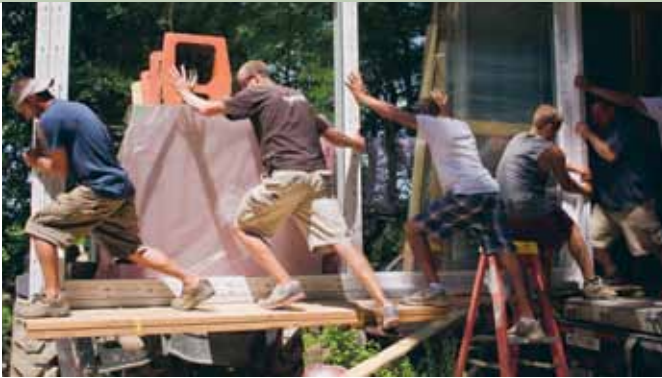
"Arbetsrätt i praktiken" var en av kurserna GBF tog fram 2014.

innebar att deltagarna fick lära sig vad de ska tänka på när företaget står inför förändringar och vilka lagkrav som gäller innan man börjar förhandla. Vidare gick vi igenom arbetstidsregler samt vad som gäller vid uppsägning på grund av arbetsbrist, personliga skäl samt avsked. På kursen lärde sig också deltagarna att förstå de svårigheter och se de lösningar som är specifika inom glasbranschen. Ett annat syfte med kursen var att deltagarna fick ett nätverk inom glasbranschen med andra som arbetar med liknande frågor i andra företag. Kursverksamheten fortsätter att utvecklas under 2015.