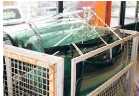
Återvinning av bilrutor.

Avtal för återvinning av bil- och planglas gällde fortsatt med SGR AB och löper vidare. GBF har arbetat med återvinningen sedan hösten 1998. Uppdraget är att ta till vara på allt laminerat bilglas från GBFs medlemmar, auktoriserade bilglasmästare och bilföretag. Insamlingen sker genom SGR och deras egna turbilar eller på orten kontrakterade företag som hämtar och levererar burarna. Glastjänster för GBF AB administrerar all hämtning.