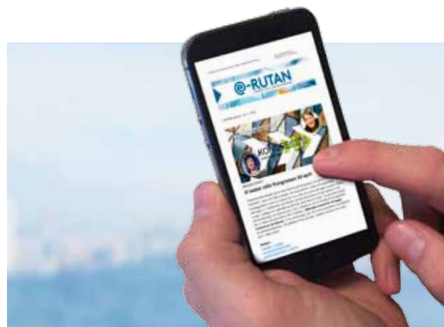
Digitala nyhetsbrevet e-Rutan.