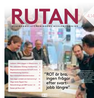
Tidningen GLAS och Rutan.