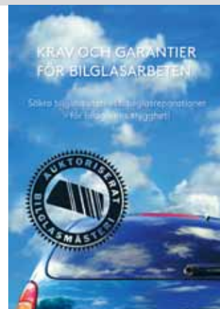
Folder från Glasbranschföreningen: "Krav och garantier för bilglasarbeten."

Projektet "Slitna vindrutor – en dold trafikfara" har fortsatt. På seminariet och utställningen "Tylösand – Trafiksäkerhet", medverkade auktorisationen med monter under tre dagar och flera kontakter med myndigheter och politiker knöts. Vid seminariet för trafikskolorna i september medverkade Auktoriserade Bilglasmästerier också med en monter.