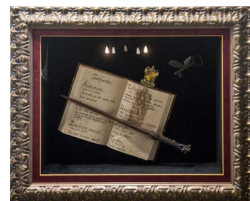
Inbjudan till Inramnings-SM 2020.