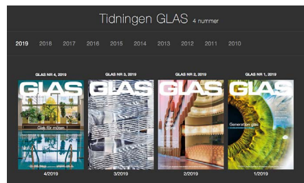
Digital plattform för tidningen GLAS.